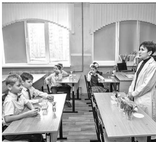
Шуховцы изучают кислотность почвы