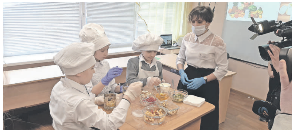
На внеурочке, посвящённой правильному питанию, ученики школы с УИОП готовят вкусные и полезные блюда