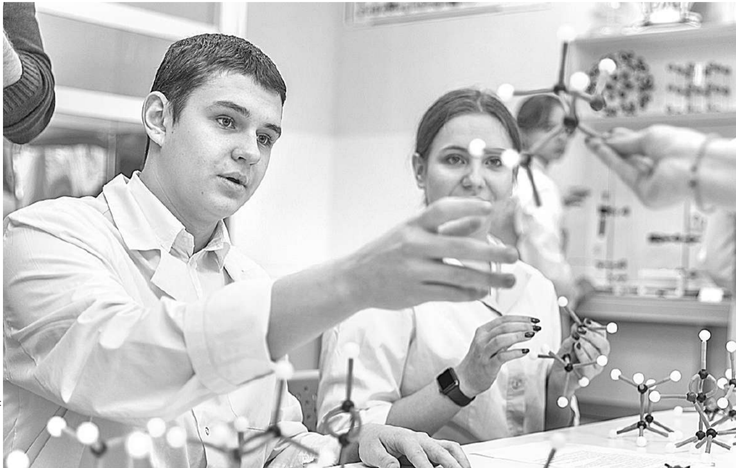
В химической лаборатории Шуховского лицея

В СОЦИАЛЬНЫХ СЕТЯХ ПОЯВЛЯЛОСЬ МНОГО СООБЩЕНИЙ О ТОМ, ЧТО СИТУАЦИЯ С КОРОНАВИРУСОМ — ЭТО ОСНОВАНИЕ ДЛЯ ПЕРЕВОДА ВСЕЙ СИСТЕМЫ ОБРАЗОВАНИЯ В ДИСТАНЦИОННЫЙ ФОРМАТ НА ПОСТОЯННОЙ ОСНОВЕ. УБЕЖДАТЬ НАРОД, ЧТО ТАКИЕ ЗАЯВЛЕНИЯ ОДНОЗНАЧНО БЕСПОЧВЕННЫ, НАМ СУЩЕСТВЕННО ПОМОГАЛ ОПЫТ ШКОЛ РАН, КОТОРЫЕ ПРОДЕМОНСТРИРОВАЛИ, ЧТО ОБРАЗОВАНИЕ — НЕ ТОЛЬКО ПРИОБРЕТЕНИЕ СУММЫ ЗНАНИЙ, НО ЭТО, ПРЕЖДЕ ВСЕГО, СОЦИАЛИЗАЦИЯ РЕБЯТ, ПЕРЕДАЧА ОПЫТА ПОКОЛЕНИЙ, ДУХОВНО-НРАВСТВЕННЫХ ЦЕННОСТЕЙ, ЧТО ЯВЛЯЕТСЯ НЕВОЗМОЖНЫМ БЕЗ ЛИЧНОСТИ УЧИТЕЛЯ, БЕЗ НЕПОСРЕДСТВЕННОГО ВЗАИМОДЕЙСТВИЯ С УЧЕНИКОМ, БЕЗ УЧАСТИЯ РЕБЁНКА В КОЛ-