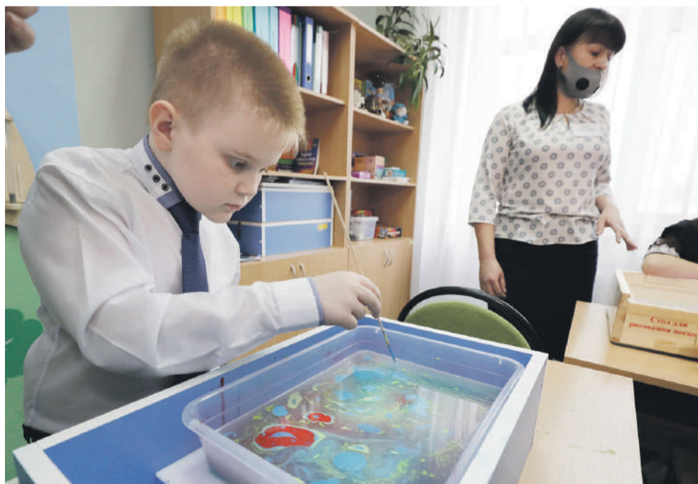
Занятие по акваанимации в Новоалександровской школе

Дальше директор ведёт нас в «деревню Йогуртово». Она расположилась в обычном классе, только вместо учебников и ручек на столе — йогурты, фрукты и другие начинки и добавки.