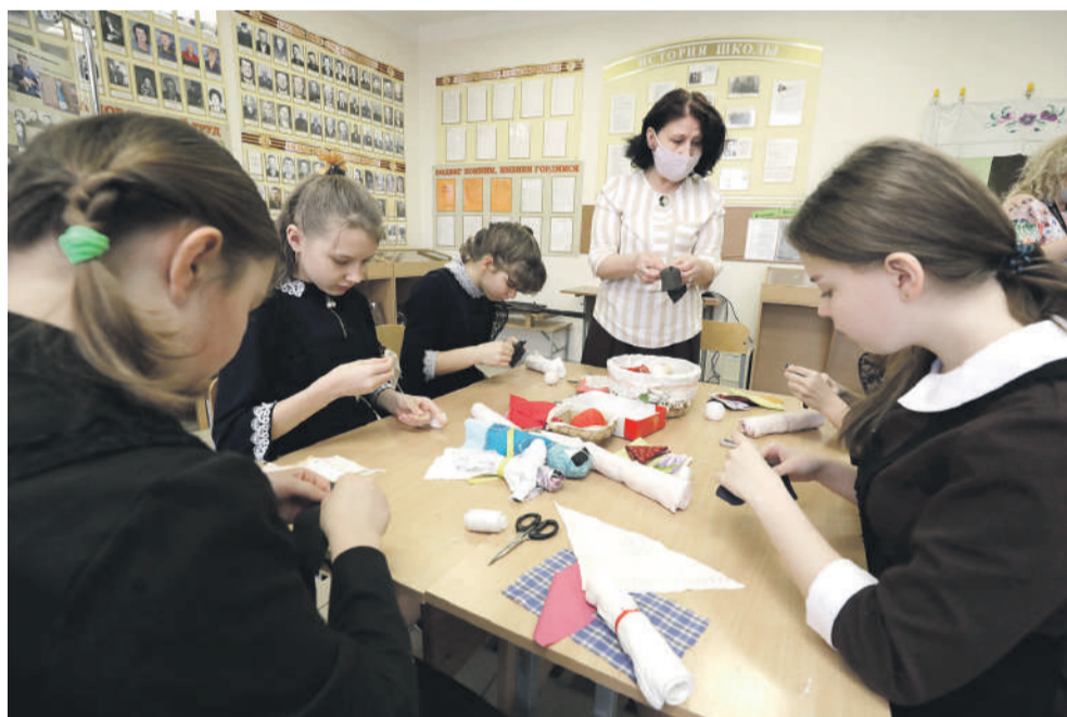
В рамках программы «Народная и авторская кукла» ученицы Новоалександровской школы учатся шить куклу-столбушку