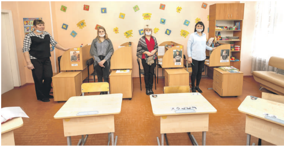
Тьюторы: каждый занимается с одним ребёнком с самыми тяжёлыми проблемами со здоровьем