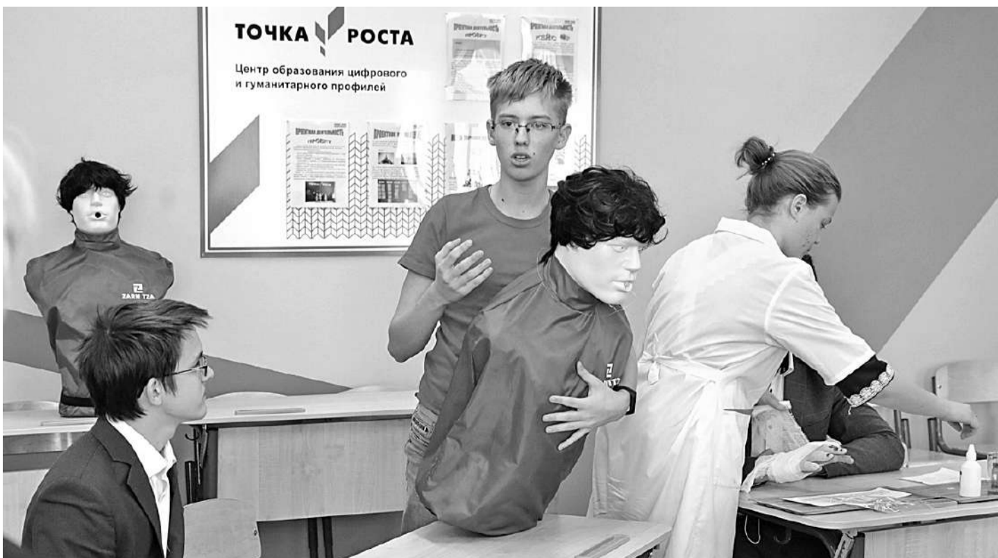
Оказывать первую помощь пострадавшим школьники учатся на манекенах-тренажёрах