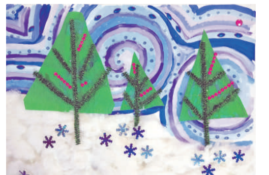
Коллективная работа объединения «Бумажные фантазии»