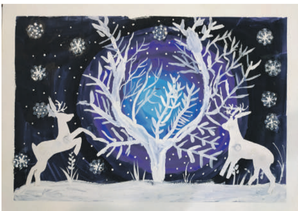
«Зимняя сказка». Рисунок Алексея Чудных (руководитель Дина Кислиця)