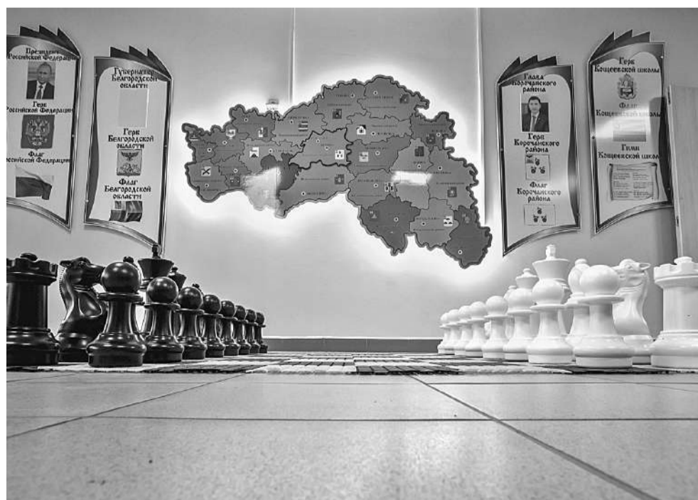
Оформление стен в Коцеевской школе Корочанского района