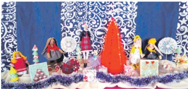
Подделки ребят из объединения «Умелые ручки»