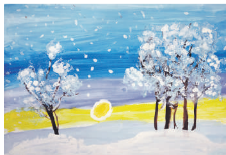
«Снег». Рисунок Юрия Кривокустава (руководитель Дина Кислиця)