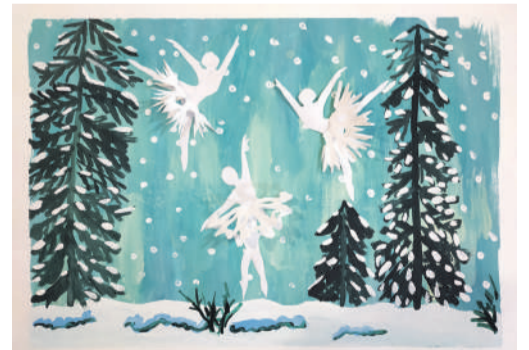
Коллективная работа объединения «Бумажные фантазии»