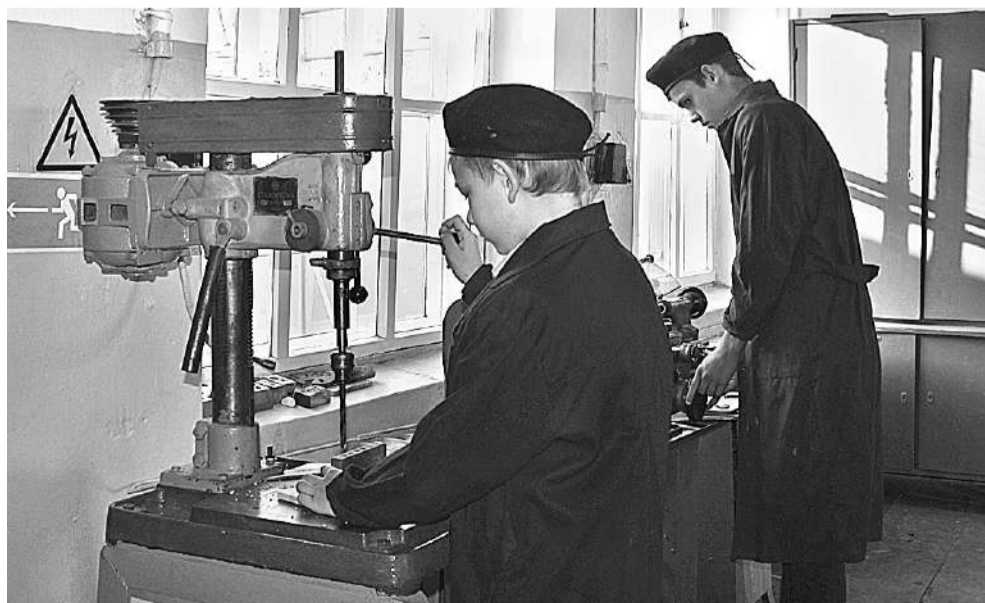
В школьной мастерской мальчишки учатся столярному и слесарному делу