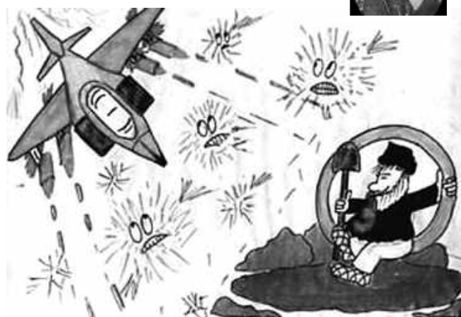
А вот таким детским «видением» браздов, ямщика и кибитки делятся друг с другом пользователи Интернета