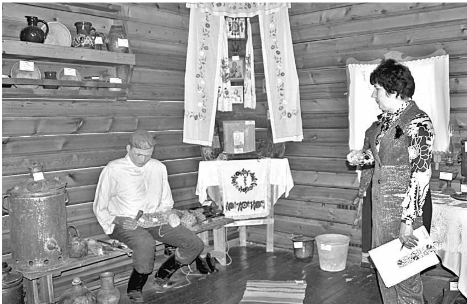
В школьном музее этнографии

НО ДАЖЕ САМОЕ КРАСИВОЕ, ПУСТЬ И ДОБРОЖЕЛАТЕЛЬНОЕ ОФОРМЛЕНИЕ МОЖЕТ СТАТЬ БЕСПОЛЕЗНЫМ, БЕЗДЕЙСТВЕННЫМ,