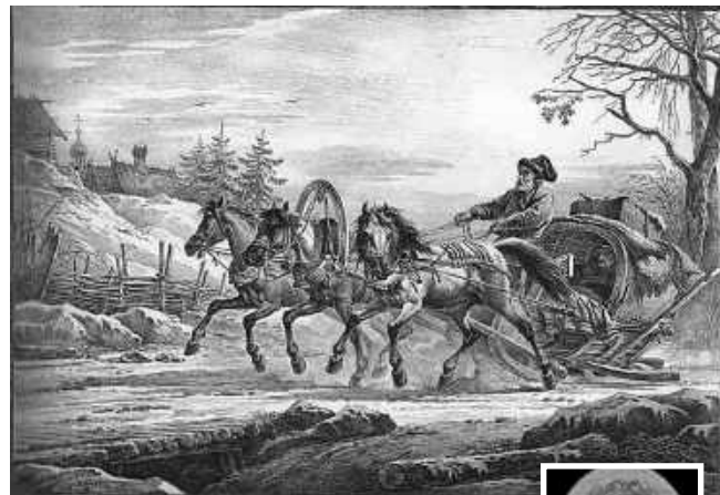
Настоящая кибитка — это крытая повозка, как на этой литографии Александра Орловского «Путешественник в кибитке, или Сани, запряжённые тройкой» (1819, Киевская картинная галерея)

Другие ученики назвали кибитку «птичкой», летящей с Кубы и крыльями поднимающей снег; «поездом, который очень быстро едет, и поэтому снег летит вверх и вниз» и даже «кибернетической, шустрой тёткой». Ямщик, по их мнению, оказался «дядей, профессия которого — таскать ящики»; человеком, роющим ямы, вероятно, карликом, «потому что сидит на чём-то маленьком и прячется в ямку».