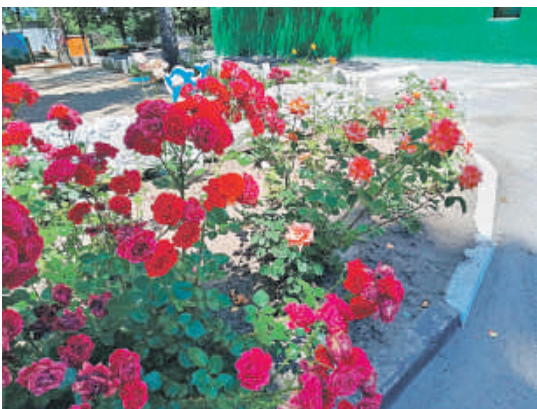
Детсад № 48 «Вишенка» г. Белгорода