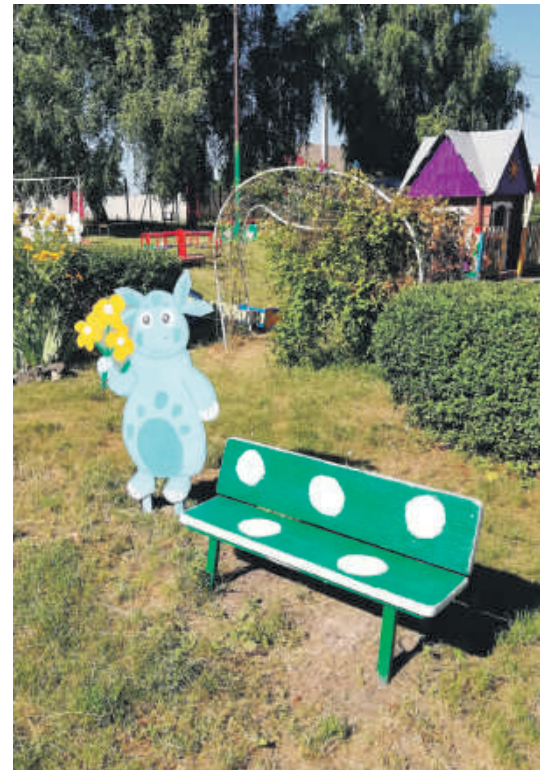
Детсад № 4 с. Алексеевка Корочанского района