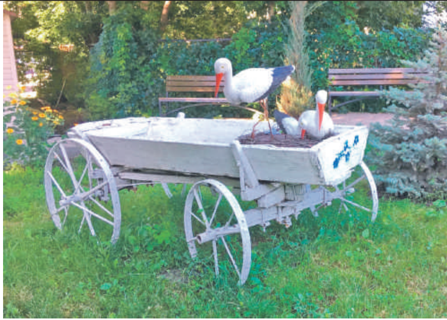
Центр образования № 1 г. Белгорода