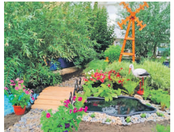
Рождественская школа Валуйского городского округа