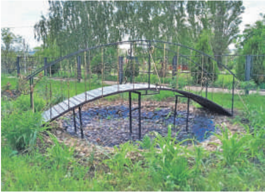
Уразовская школа № 2 Валуйского городского округа