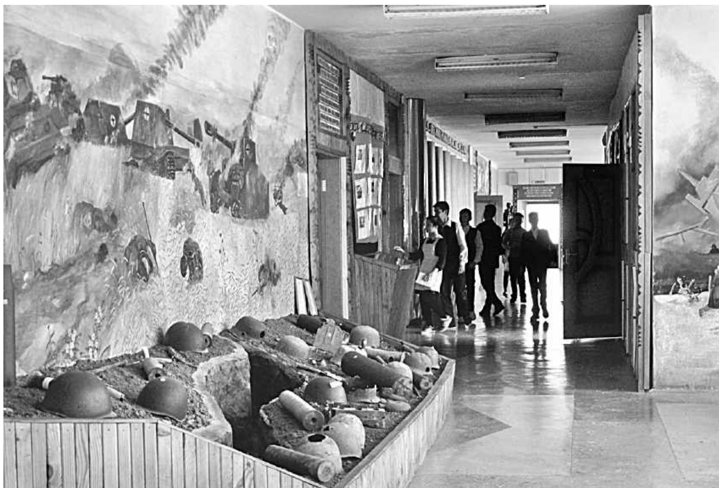
Школьный музей Великой Отчужденной войны