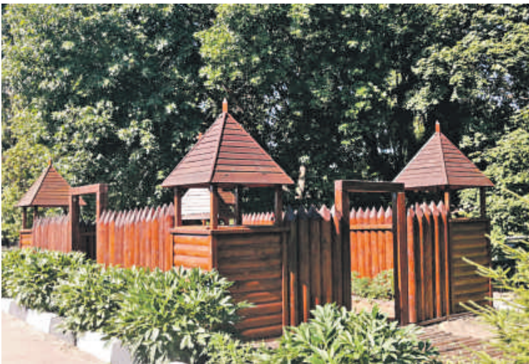
Школа № 4 г. Валуйки

Школа начинается со школьного двора. От того, как он обустроен, зависит многое. Настроение ребят и учителей. Их желание идти в школу. Адаптация первоклассников к учебной жизни. Недаром на Белгородчине уже много лет проводят конкурсы на лучшее обустройство школьных территорий. Если к делу подойти с душой, то школьный двор можно превратить и в ботанический, и в сказочный сад, и в обучающее пространство. В группе «Доброжелательная школа Белогорья» в соцсети «ВКонтакте» мы попросили учителей и учеников поделиться с редакцией фотографиями дворов их школ. И детских садов. Давайте вместе полюбуемся на нашу школьную красоту! Ну и в нашем редакционном портфеле кое-что нашлось.