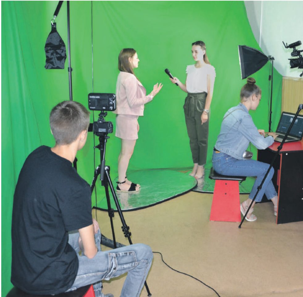
В школьном медиацентре «МедиаДикт» школы № 1