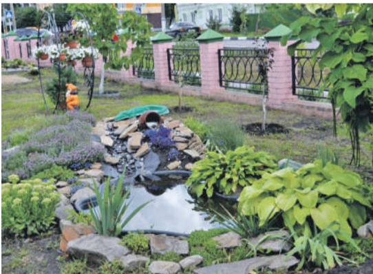
Ландшафтный дизайн на территории школы № 2