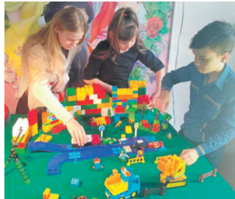
Студия мультипликации в Доме детского творчества