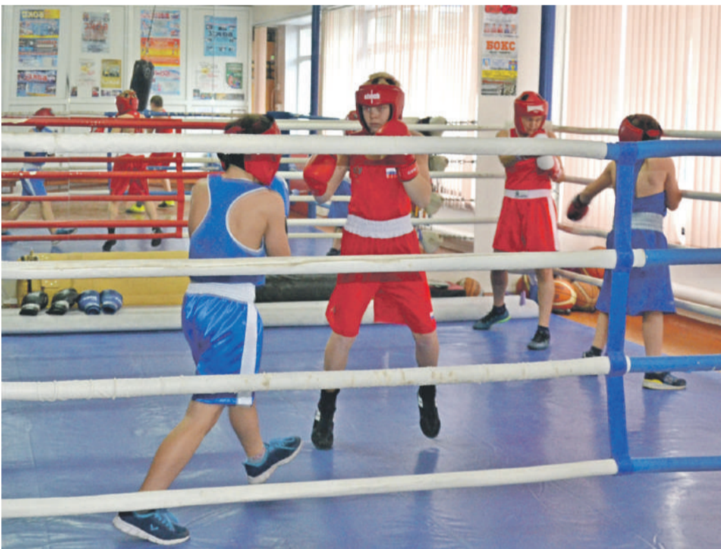
Тренировки по боксу в школе № 4