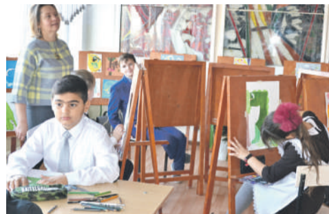
В изостудии школы № 4